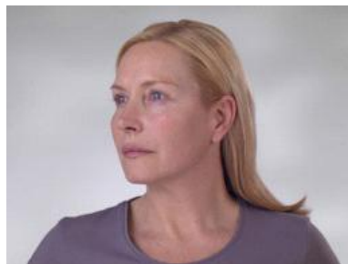
7 miesięcy po zabiegu